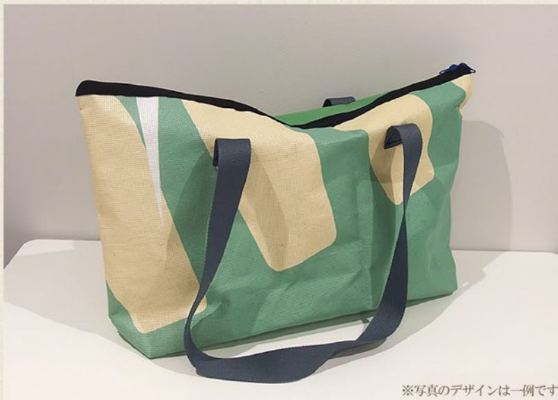
※写真のデザインは一例です

シートの柄はすべて異なるため、オンリーワンのトートバッグができます。たくさん物が入るサイズなので買い物や習い事用にぴったりのバッグです。男性・女性を問わないデザインなので幅広いコーディネートにお使い頂けます。