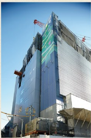
建築中のYKK80ビルの壁を飾っていたクリスマス柄のシートを使います

建築中の建物に掲げる建築広告シートは撤去後、廃棄される運命にあります。6月に竣工となったYKK80ビル(YKK新本社ビル)に掲示していた建築広告シートも例外ではありません。処分されるはずだった、そのシートを使って、おしゃれなトートバッグをつくるワークショップを開催します。丈夫で軽く通気性に優れた素材はバッグにぴったり。シートの柄を選んで、あなただけのトートバッグをつくってください。