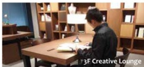
3F Creative Lounge