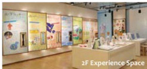
2F Experience Space