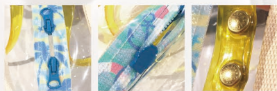
ファスナー(表) ファスナー(裏) ボタン

これからのシーズンに向けて、海やプールで使えるビニールバッグを自分で作ってみよう！大きさはタオル、水筒が収納しやすい横37cm×縦33cm。YKKオリジナルの両面プリント止水ファスナーやリベット（金属製の留め具）を使用し、オシャレなだけでなく丈夫で使いやすいバッグです。夏休みの先取りや、お子様の早めの自由研究にいかがでしょうか？