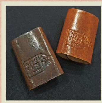
表 紙は台東区の革小物の店 mic 特製の革を用意。2色からお選び下さい。後ろにもものづくり館オリジナルの版が入っています。