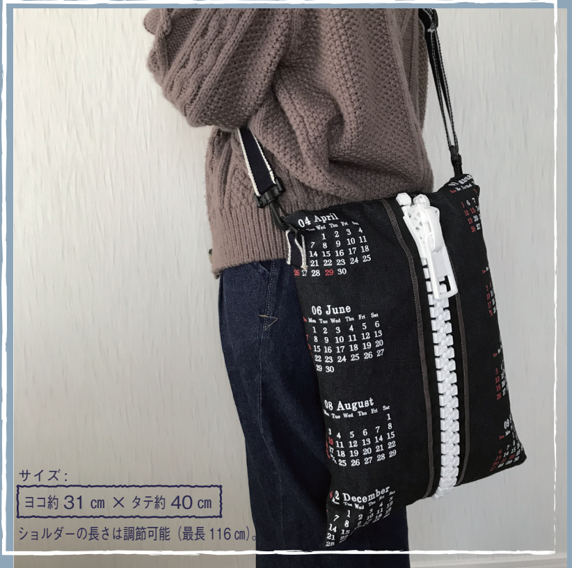
写真のバッグは2020年のカレンダーを使用しています。