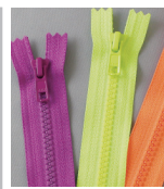
ビスロン® ネオンカラー