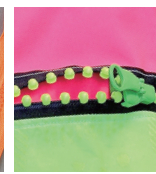
ビーズファスナー