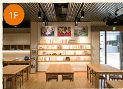
ワークショップ Work Shop 80㎡

ものづくり体験ができるスペース。ものづくり館主催のファスナーやボタンを使ったワークショップの他、外部主催のイベントも行っていきます。