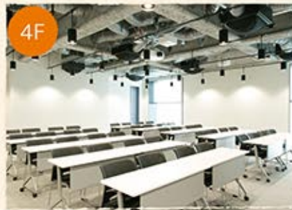
セミナールーム Seminar Room 約100㎡

ファスナーやボタンの特殊アイテムやトレンド情報を紹介する展示スペース。デザイナー・クリエイターの皆さんの情報交換の場としてもご利用いただけます。