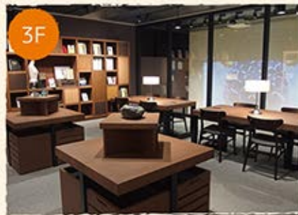
クリエイティブ ラウンジ 50㎡ Creative Lounge

ファスナーのしくみや歴史が学べる展示スペース。中央の大テーブルではファッション・シミュレーター「きせかえくまちゃん」でシールが作れます。