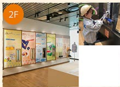
学び舎 50㎡ Experience Space

ものづくり体験ができるスペース。ものづくり館主催のファスナーやボタンを使ったワークショップの他、外部主催のイベントも行っていきます。